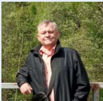
Dôchodca, presbyter od roku 2012

Na našom cirkevnom zbore sa mi páči spôsob, ako sa v cirkevnom zbore pracuje s veriacimi, aby neboli evanjelikmi iba na papieri, ale aby sme ich pritiahli na služby Božie. Veľmi dobrým príkladom sú rodinné služby Božie, ktoré navštevuje čoraz viac veriacich. A samozrejme množstvo aktivít, ktoré sú v cirkevnom zbore organizované.