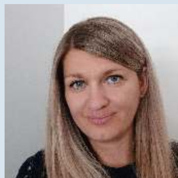
IT – operation manager, presbyterka od roku 2024

Na našom zbore sa mi páči, že je to môj duchovný domov, kde som vyrástla a našla v ňom spoločenstvo bratov a sestier, kam patrí. Spoločne tvoríme duchovnú rodinu, ktorá si môže navzájom slúžiť.