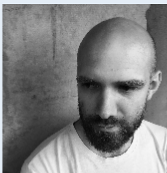
Konateľ spoločnosti, presbyter od roku 2023

Na našom zbore sa mi páči: jednota, všestrannosť a že napriek našim mnohým nedokonalostiam Pán Boh koná svoje dielo cez nás